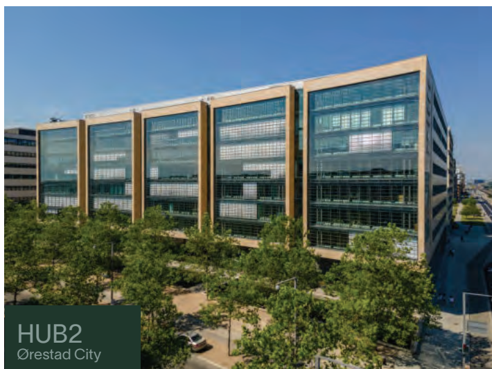
HUB2 Ørestad City