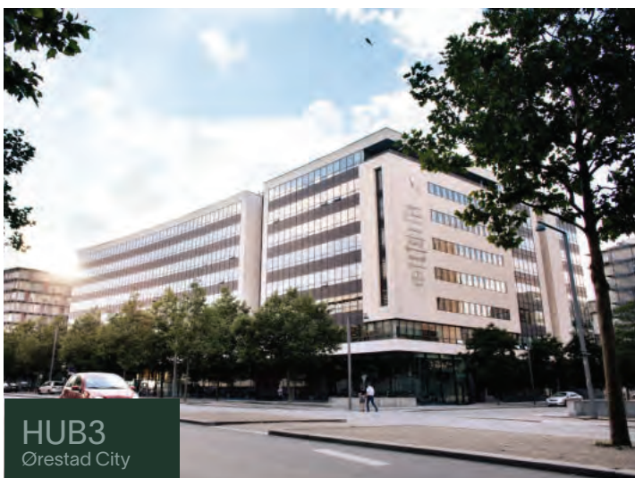
HUB3 Ørestad City