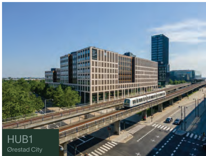
HUB1 Ørestad City