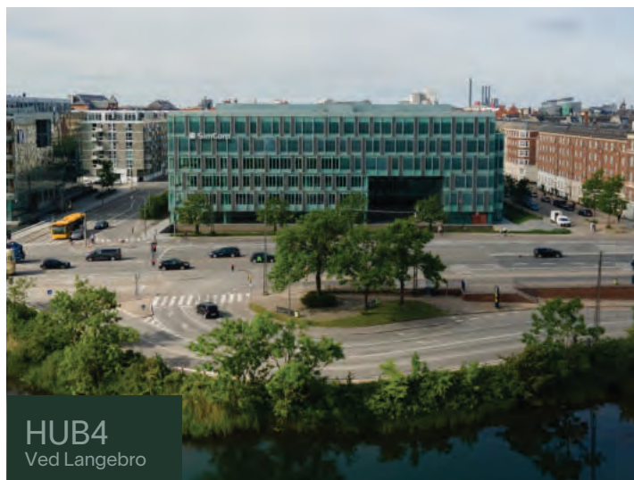
HUB4 Ved Langebro